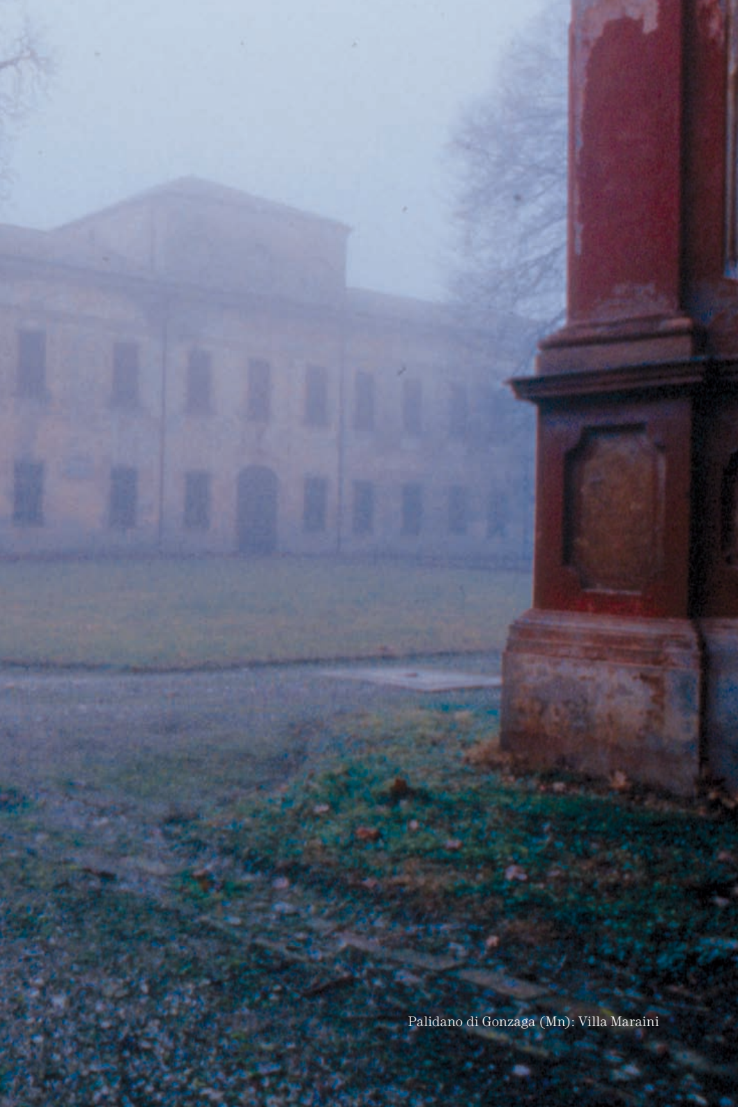
Palidano di Gonzaga (Mn): Villa Maraini