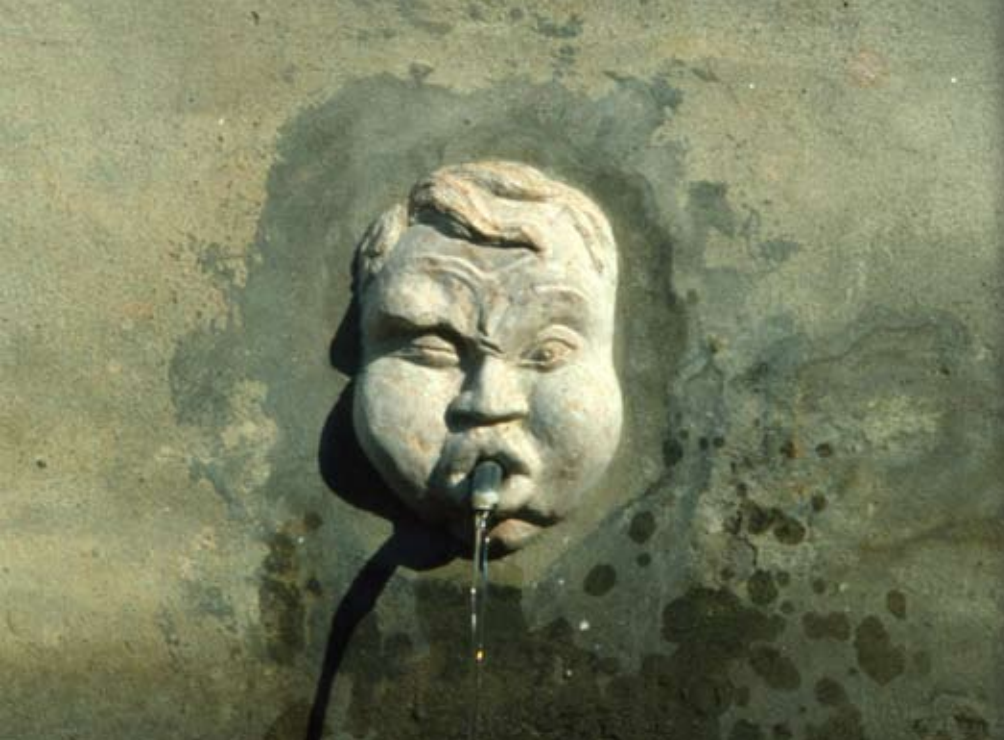
Isola Dovarese (Cr): fontana del lato sud dell'Oratorio di San Giuseppe

mantovana quando Federico II Gonzaga nel 1517 sposa Maria Paleologo, che poi ripudierà ma tornerà a vantare come propria moglie quando questa diverrà erede del Monferrato; la poveretta morirà alla vigilia della celebrazione del secondo matrimonio, e infine tutta la vicenda culminerà con il nuovo matrimonio di Federico con la sorella di Maria, Margherita.