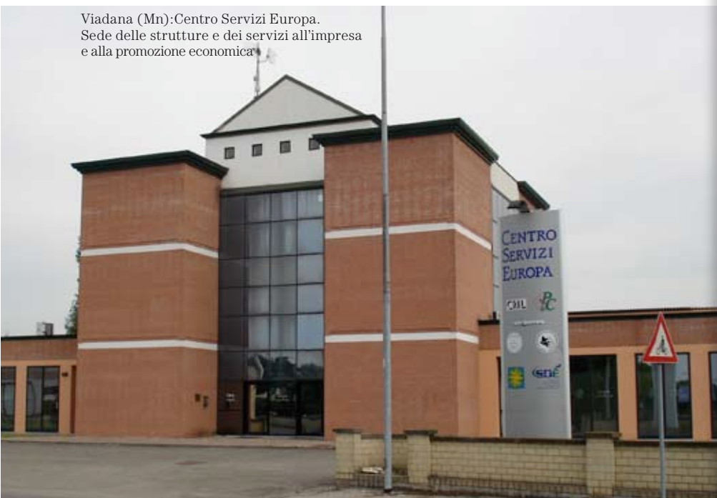
Viadana (Mn): Centro Servizi Europa. Sede delle strutture e dei servizi all'impresa e alla promozione economica