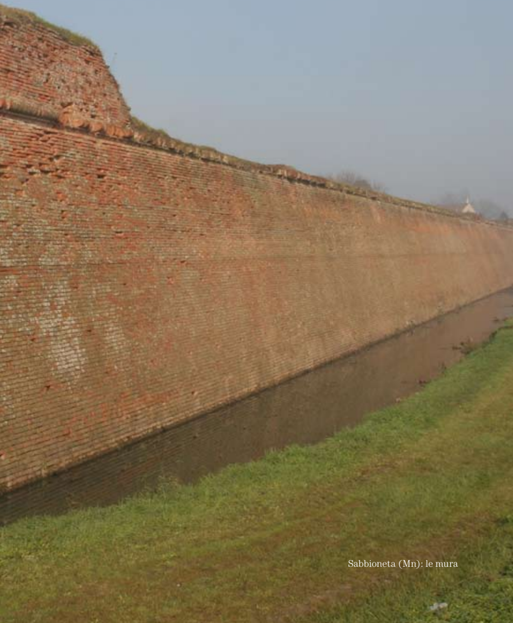
Sabbioneta (Mn): le mura