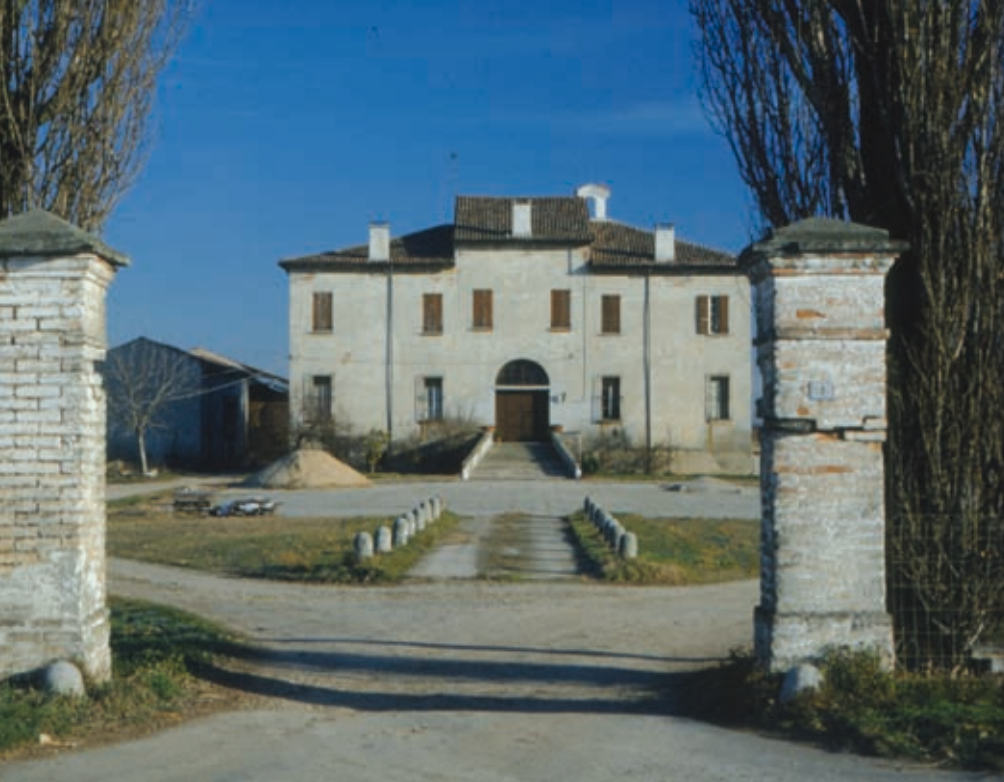
Canicossa di Marcara (Mn): Corte Antonia

A seguito del successo conseguito dall'iniziativa sfociata nel Forum del 4 dicembre 2007 a Sabbioneta e alla luce delle analisi sviluppate con esplicito riferimento alla consistenza del progetto presentato, si è proceduto a programmare le fasi successive. Di seguito le principali tappe previste per la sua realizzazione.